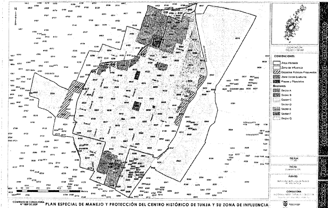
Imagen n° 4. Plano PRO-07 SECTORES URBANOS NORMATIVOS - EDIFICABILIDAD. Resolución 0428 de 27 de marzo de 2012

Que el Plano PRO-07, Sectores Urbanos Normativos - Edificabilidad. Resolución 0428 de 27 de marzo de 2012, define el sector en el cual se localiza el inmueble como Sector A.